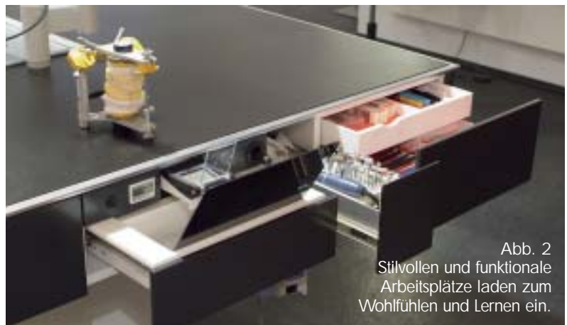
Abb. 2 Stilvollen und funktionale Arbeitsplätze laden zum Wohlfühlen und Lernen ein.

für die Zahnmorphologie und seine Komplexität grundlegend zu vertiefen.