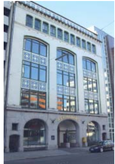
Abb. 1 Im traditionsreichen Hamburger Afrikahaus können sich Zahntechniker und Zahnärzte im Rahmen des GOP-Dentaltrainings fortbilden.