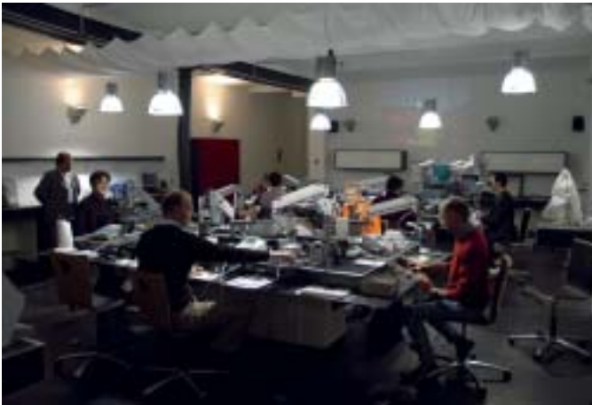
Abb. 3 Konzentriertes Arbeiten in den modernen und großzügigen Kursräumen.